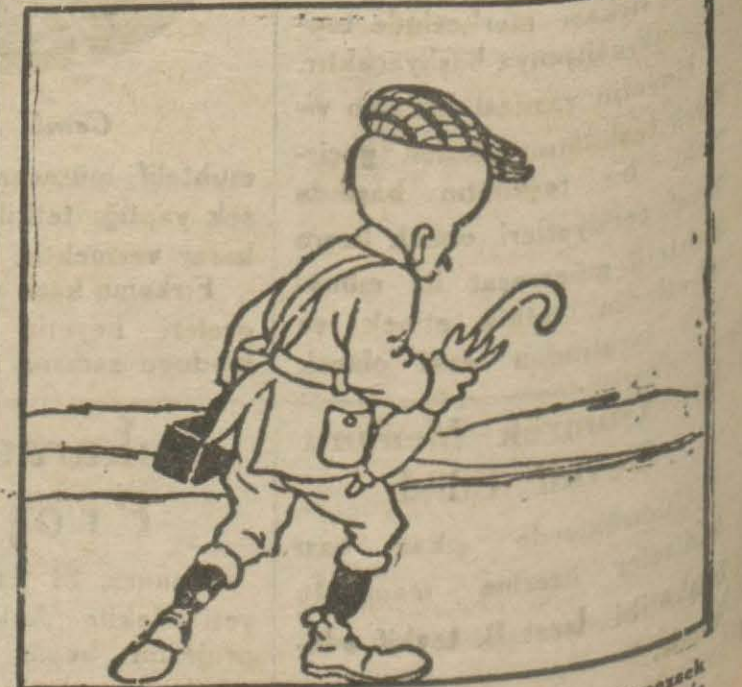
4: Hasan Bey — Biz de limanımıza bu hale getirmişsek birkaç seneye kalmaz en sevginimize varmaya kadar hepimiz mis kokos alayız d..seriz.