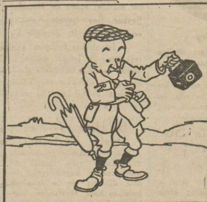
3: Hasan Bey — Ben bu Pire limanını gördükçe pirceleniyorum doğrusu...