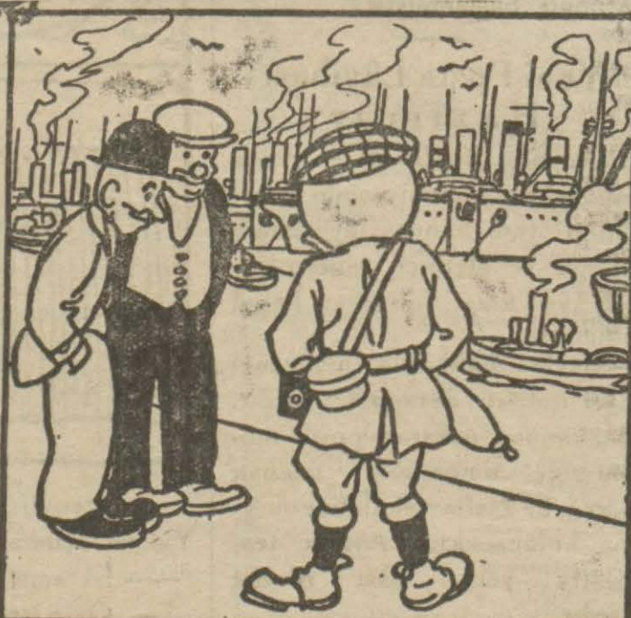
2: Hasan Bey — Vay canına.. Yahu bu ne kalamak limanı! İğne atan suya düşmez!